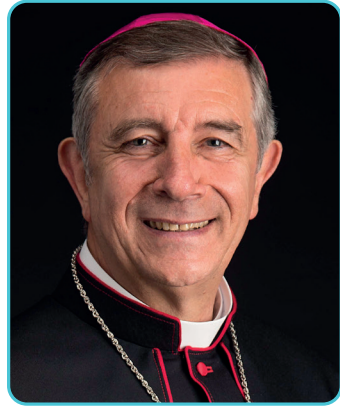
† José Luis Retana Gozalo Obispo de Ciudad Rodrigo

Uno de los problemas más importantes, si no el mayor, es el de las vocaciones al presbiterado y a la vida consagrada. «Toda la renovación de la Iglesia consiste esencialmente en el aumento de la fidelidad a su vocación» (EG 26).